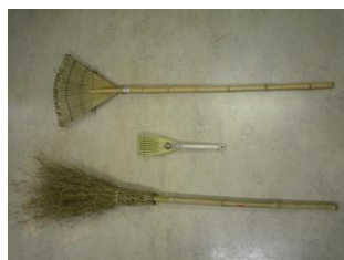
竹クマデ（上） ミニクマデ（中） 竹ボウキ（右）