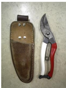
剪定バサミとケース