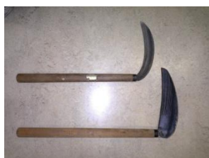
薄ガマ（上）・中ガマ（下）