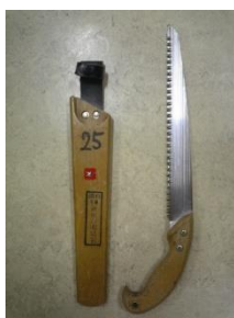
剪定ノコギリとケース