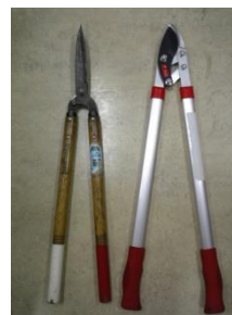
刈込バサミ（左） 太枝切りバサミ（右）