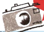
第12回最優秀賞作品「春の訪れ」