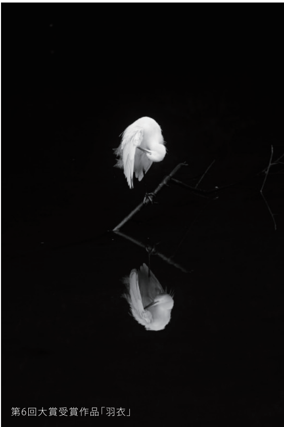
第6回大賞受賞作品「羽衣」