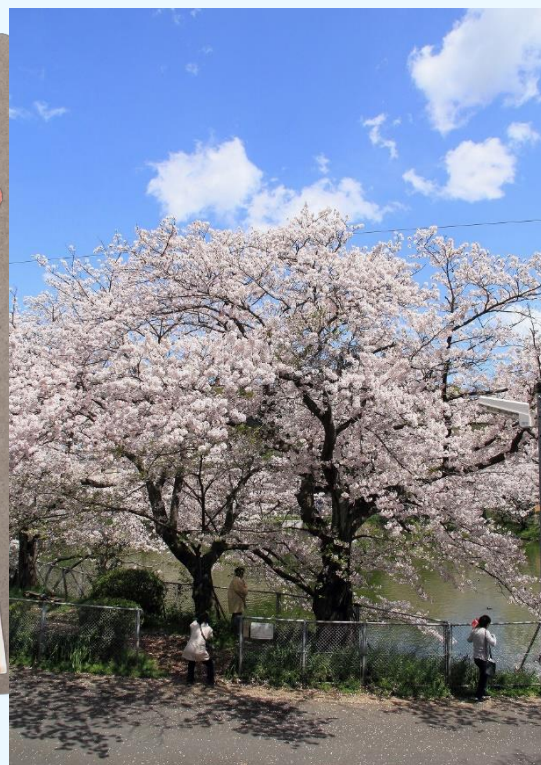
第7回最優秀賞受賞作品「桜日和」