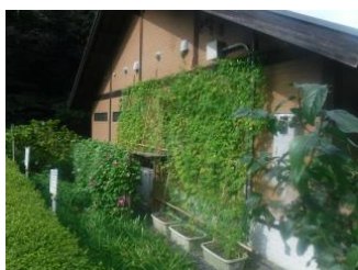
夫婦池公園パークセンター

夫婦池公園にゴーヤ、鎌倉中央公園には皇帝ダリアと朝顔のカーテンを設置し、夏季における空調節電と資源利活用を図ることで緑化の普及と啓発に努めました。