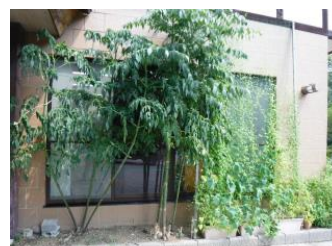
鎌倉中央公園管理棟