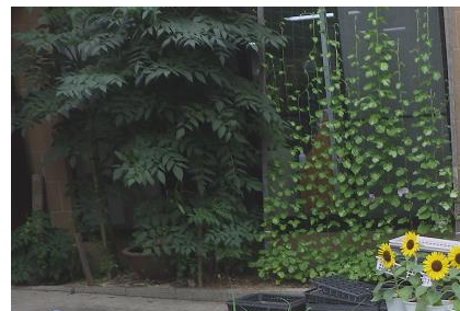
鎌倉中央公園管理棟