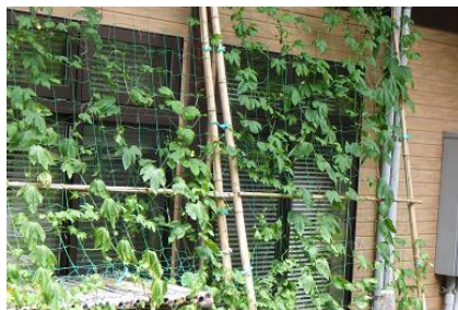
夫婦池公園パークセンター

夫婦池公園、鎌倉中央公園にゴーヤ等のカーテンを設置し、夏季における空調節電を兼ねた緑化の普及と啓発に努めました。