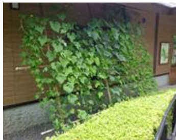
夫婦池公園パークセンター

夫婦池公園、鎌倉中央公園にゴーヤ等のカーテンを設置し、夏季における空調節電を兼ねた緑化の普及と啓発に努めました。