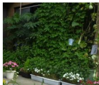
鎌倉中央公園管理棟